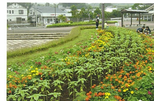
県立秦野戸川公園の植栽事業

ウスの中がフィールドです。でも、とても健康的なお仕事です。体力もつきました。それに来られているお客様に励ましの声をかけていただけただけで、とても幸せな気分になります。それから、観葉植物のリースもやっています。今はホテルと老人ホームの2か所だけですが、今後開拓してより多くの会社やお店にも置いてもらいたいと思っています。そうそう、あと植栽管理ということで、お庭の草刈りや芝刈りなどもやっています。つまり、お花に関する様々なことを全般にわたってやっていることとなります。